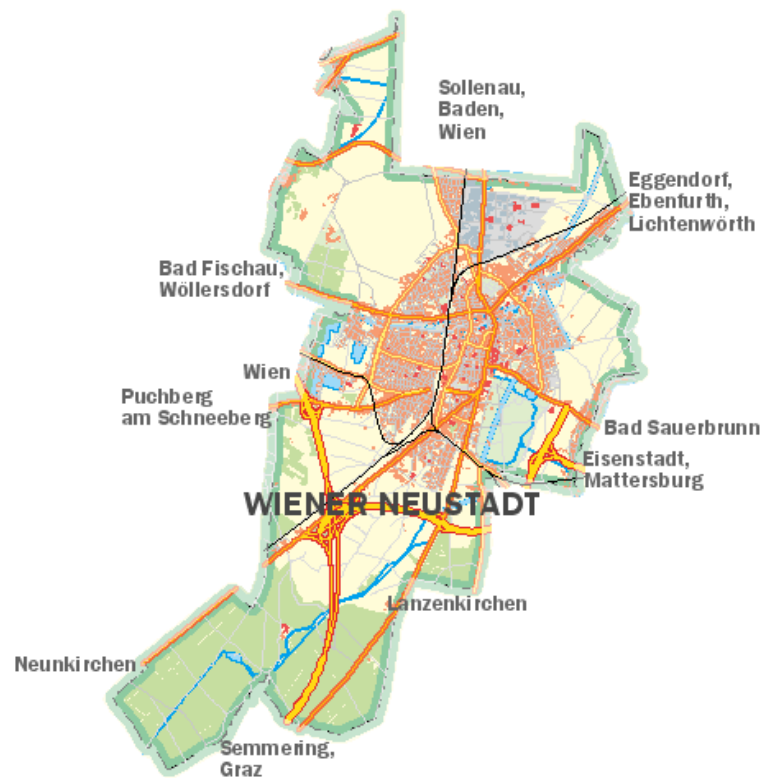
Abbildung 2: Karte von Wiener Neustadt